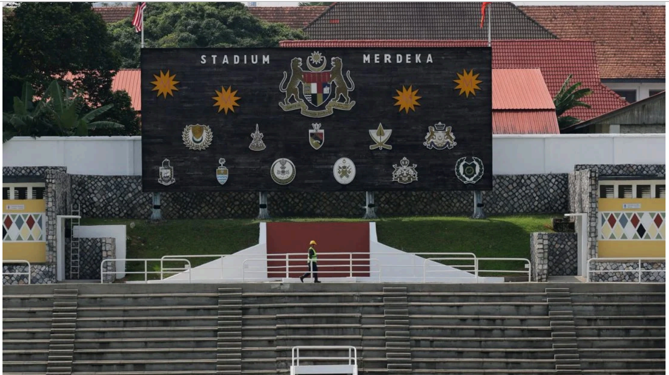
默迪卡体育场修建后将以原来的面貌呈现在人们眼前，当年东姑阿都拉曼就是在这里高喊七次“MERDEKA”，马来西亚正式宣告独立。