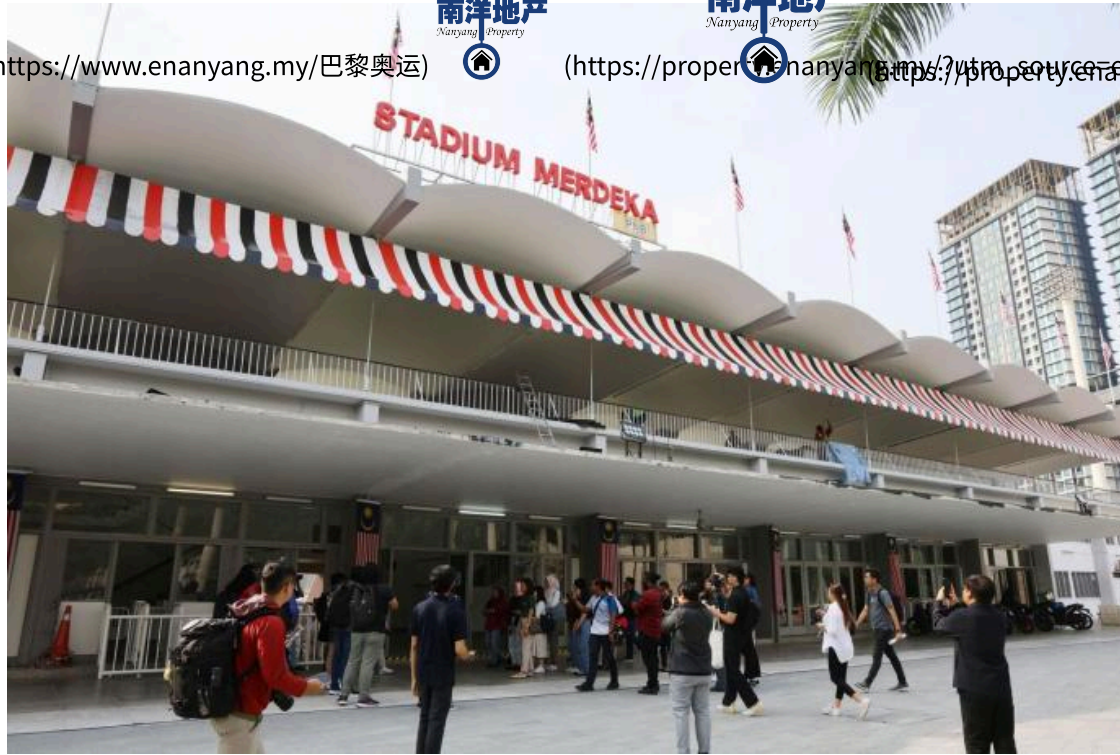
默迪卡体育场大门入口。 默迪卡体育场

( https://property.enanyang.my/?utm_source=enanyang&utm_medium=desktop-float-logo-top )