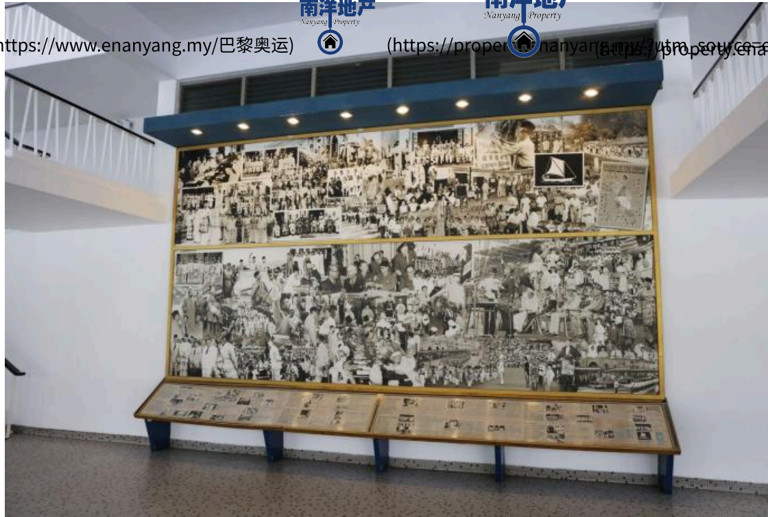
大马独立历史走廊。 南洋商报