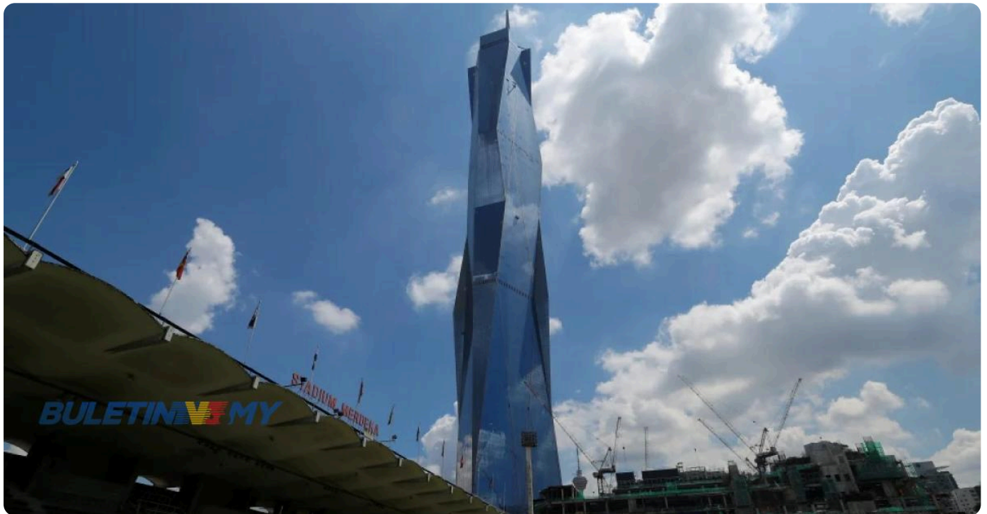
Menara Merdeka 118

KUALA LUMPUR: Projek Menara Merdeka 118 PNB Merdeka Ventures Sdn Bhd (PNBMV) melakar sejarah apabila dianugerahkan pensijilan Platinum Kepimpinan dalam Tenaga dan Rekabentuk Alam Sekitar (LEED) dalam sistem penarafan Teras dan Shell LEED v2009.