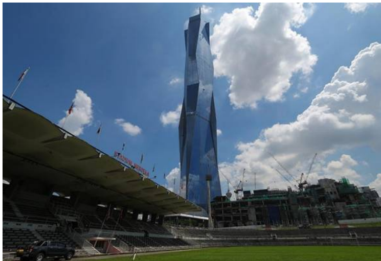
Stadium Merdeka dijangka dibuka semula kepada orang ramai menjelang suku pertama tahun depan selepas ditutup sejak 2016.

KUALA LUMPUR: Pemulihan Stadium Merdeka, lokasi keramat pengisytiharan kemerdekaan negara pada tahun 1957, dan pembangunan Menara Merdeka 118 yang berdiri gah bersebelahannya benar-benar mencerminkan sejauh mana negara telah berkembang maju.